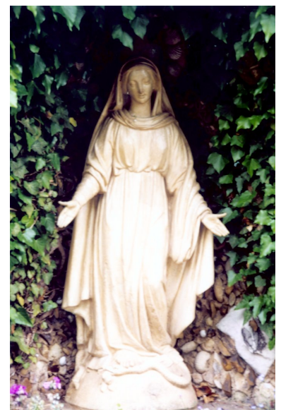
聖女喜歡在這裡向聖母媽媽祈禱

本圖文下載版 • PDF download : http://bluedaily.net/20080418.pdf • 來函或分享 email : bluedaily2006@gmail.com