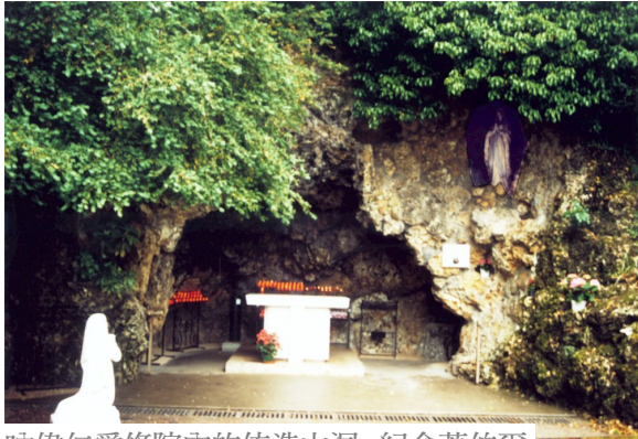
吶偉仁愛修院內的仿造山洞，紀念著伯爾納德離開露德後，曾在此隱修度餘生。

最痛苦的，還是對聖母的思憶也要壓抑，因為稍為流露對露德的依戀，都會讓人誤會犯上驕傲，恃靠聖母的特寵。所以聖女不但要遠離露德，千里迢迢，到陌生的吶偉去隱修；在修院裡也要隱斂自己的身份，不顯露些微的自矜，或對聖母的思念。