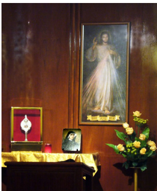
聖母院堂區小聖堂，香港

完全相信是主耶穌親自的召叫和默 啊，否則，怎會那麼早便有幸認識和參與「救主慈悲」敬禮呢？還記得香港最初推動「救主慈悲」敬禮時，一位教友在聖堂外請教友簽名支持。我們正在閱看介紹的資料時，一位虔敬事主的神父剛巧經過，在旁鼓勵我們說：「簽名愛主？那是福氣啊！」於是，我們歡樂地，從此表明決意信賴救主的慈悲。