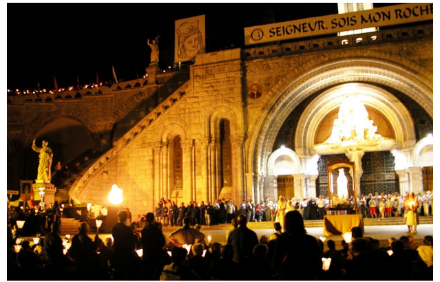
2003，露德朝聖地的主題是 Seigneur, sois mon rocher (上主是我的磐石)

聖母是聖神的淨配，教會的慈母，一直帶領教會認識天主的奧妙救恩。1858 年，聖母親自於露德，宣布了自己的身份，確認了教會的頒布。3 月 25 日，聖母第 16 次顯現時，伯爾納德向群眾說：「夫人說了：『我是始胎無染原罪』。」伯爾納德是以露德當地的土話，照著聖母的話