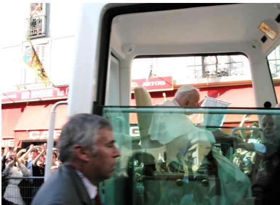
2004 年，教宗若望保祿二世扶病親臨露德，主持聖母始胎無玷信理頒布 150 周年慶典活動

說的，但還未初領聖體的她，根本不知道這話的含義。群眾極度震驚和興奮，知道並相信向小女孩顯現的，就是「始胎無染原罪」的天主之母。而正由於伯爾納德根本從未聽過、也不知道「始胎無染原罪」是甚麼意思，於是她就不再被懷疑是製造奇蹟或說謊了。