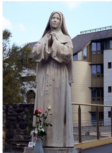
安放在露德病人大樓附近的聖女伯爾納德像

聖女本來就生得矮小，身體孱弱，經常哮喘咳嗽。事實上，如不是因為怕冷，不敢過河，她就不會獨自留在山洞前，蒙恩得見聖母。露德的泉水治癒了許多病人，但聖女一生，飽受各種疾病的疼痛折磨，奇蹟沒有在她身上出現。根據訥偉（Nevers）修院的修女所說，聖女患病的種類多得嚇人，包括心悸、嘔血、膿腫、瘤和骨疽等，痛得她徹夜呻吟。而哮喘嚴重，也常令她幾乎窒息。但她為了克服疾病對提升神修的阻礙，一直默默忍受，把痛苦盡量隱藏。她更常為自己不能好好工作，常要臥床而自責：「我一生無用！」「我慚愧得很！」當然，她最大的痛苦，還是來自對聖母的思念，對露德的回憶，但為了謙抑，她只能壓抑自己的情感。