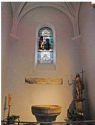
露德主教座堂，聖女領洗的聖洗池

剛過了的2月18日，為露德來說，是一個重要的紀念日子，當地訂此日為 Feast of St Bernadette，因為150年前，聖母在這天第三次向聖女顯現，邀請她十五天到山洞來。聖母又發出訊息，要求建造一間聖堂。聖母並向聖女說，她要在世上受許多苦，她的幸福不在世上。露德聖地為紀念這事，18日晚的燭光遊行會由聖女領洗的露德主教座堂出發。