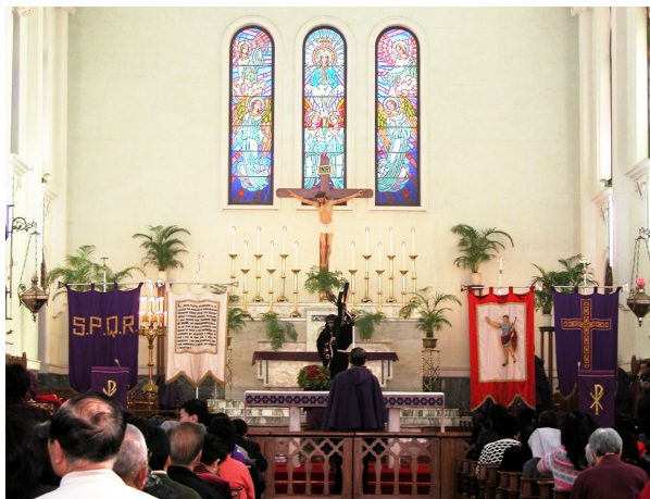
聖母誕辰主教座堂，澳門

印象中，這幾年的四旬期，都與中國的農曆新年巧遇。去年年初四是聖灰瞻禮，大前年的聖灰瞻禮更剛好在大年初一，香港教區體恤民族傳統，寬免了教友守大小齋。今年聖灰瞻禮在大除夕，香港教友也特蒙寬免了守大小齋的規誡。事實上，在喜氣洋洋的農曆新年期間，大家對已踏入四旬期，需要克己補贖的感覺，難免會薄弱了。